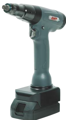
Wkrętarka pistoletowa PSXBW