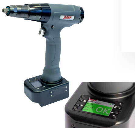
Wkrętarka pistoletowa PSXSBW